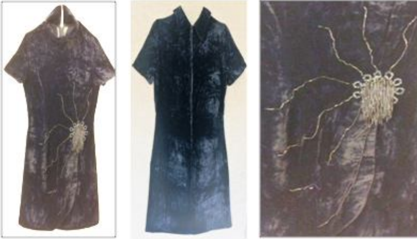
Fotoğraf 17: Nurselen Şener'e gelin ağırlığında dikilen ipek kadife elbise ön, arka ve işleme 58 (Mayıs 2018)

Yapılan araştırmada Nurselen Şener'e gelin ağırlığı olarak dikilen kıyafetlerden birisine ulaşılmıştır. Kıyafet 1968 yılında, Trabzon'da terzi Neriman hanım tarafından lacivert renk ipek kadife kumaştan dikilmiş, gezme kıyafeti olarak kullanılmıştır. Kumaş, Trabzon'da Menekşe Mağazasından satın alınmıştır. (Fotoğraf 17)