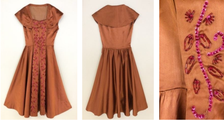
Fotoğraf 9: Nermin Kocabaş'a düğün ağırlığında dikilen atlas saten elbise ön, arka ve nakış detay.

Düğün ağırlığı olarak Nermin Kocabaş'a Ortamahalle'de terzi Neriman Hanım tarafından dikilmiş giysilerden bir tanesi aile tarafından hatıra olarak korunmuştur(Fotoğraf 9).