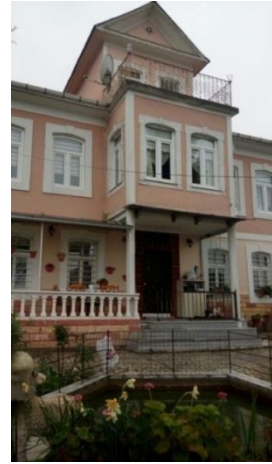
Foto 10: Nermin Kocabaş nişanı. Foto 11: Nikâh fotoğrafı. Foto.12. Gelin gittiği ev