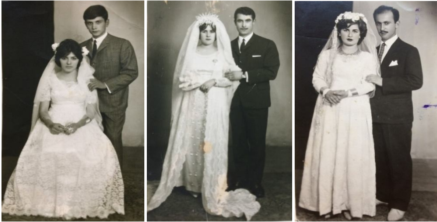
Fotoğraf 38, 39, 40: Ortamahalle'de Gelin ve Damat Kıyafetleri 77

Beyaz gelinliğin dünyada ve Türkiye'de yaygınlaşması 1930'lu yıllardan başlayarak Akçaabat Ortamahalle'de de etkisini göstermiş, 1930'lu yıllarda kırsal kesimde yaygın olarak kullanılan, pembe, mavi renkli gelinlikler yerine beyaz veya krem renkli gelinlik kullanılmaya başlanmış, beyaz gelinlik kullanımı gelenekselleşerek günümüze kadar devam etmiştir.