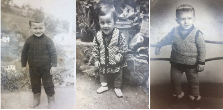
Fotoğraf 23, 24, 25: 1960'lı Yıllar, Ortamahalle'de Çocuk Kıyafetleri 66