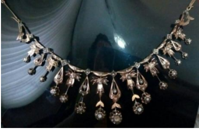
Fotoğraf 8: Nermin Kocabaş'a düğün ağırlığında yaptırılan elmas dal gerdanlık 54 . Nisan 2018

en kumaş olarak siyah ve açık renk döpiyeslik, ipek bluz ve elbiselik, empirme ve yünlü kumaşlar, gecelik ve sabahlık kumaşları, ayakkabı, çanta, çorap ve gerektiğinde kullanmak üzere Vakko marka ipek eşarp alınmış, siyah renk döpiyeslik kumaştan kışlık, açık renk döpiyeslik kumaştan yazlık döpiyes, ipekli kumaşlardan elbise ve döpiyes içine bluz, empirme kumaşlardan sıfır yakalı ve kolsuz elbise ve üstüne aynı kumaştan pardesü, ipekli kumaştan gecelik-sabahlık diktirilmiştir 52 . Nermin Kocabaş'ın gelin ağırlığı mahalle terzisine diktirilmiş, diktirilen kıyafetler ve sipariş verilen takılar bohçalanarak düğün öncesi, Ortamahalle'deki kız evine, Dürbünar Mahallesinde yaşayan oğlan evinin hanımları tarafından getirilmiş, ağırlık kız evinde sergilenerek akraba ve koşullara gösterilmiş, Nermin Kocabaş 1960 yılında Kamil Derya Kocabaş ile evlenmiştir 53 .