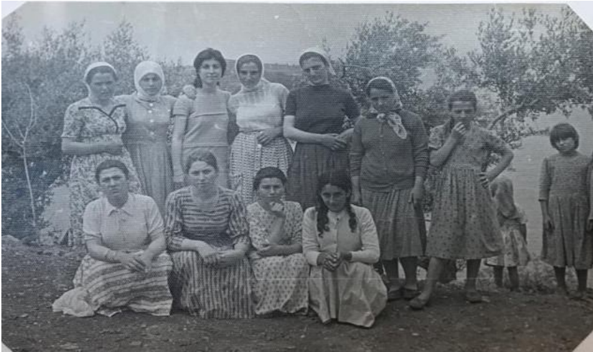
Fotoğraf 50: Ortamahalle'de okulda açılmış olan biçki- dikiş kursu öğrencileri 81

Fotoğraf 50 bu kurslardan birine ait olup, kursa katılan öğrencilerin genellikle çevre mahallelerden geldiği, kıyafetler incelendiğinde elbiselerin basma kumaştan, belden kesik modelde dikilmiş olduğu, bazı öğrencilerin ise etek, kazak, hırka giydiği görülmüştür. Kurs bittikten sonra bu kişilerin hem kendi kıyafetlerini, hem de ev halkının kıyafetlerini dikerek, bir kısmının ise bunu meslek haline getirerek aile ekonomisine katkı verdiği belirtilmiştir.