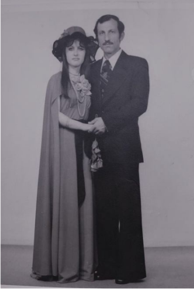
Fotoğraf 36: Ortamahalle 1970’li yıllara ait nikâh fotoğrafı

iki kat kordon ve bilezik görülmektedir. Şapka çevresi ve bele bağlanan kuşakta siyah renk kumaş kullanılmış, şapka ön sol kısmı yapma çiçek ile süslenmiştir.