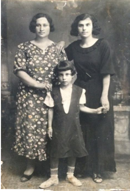
Fotoğraf 60: 1937 yılı, Akçaabat, Ortamahalle'de çekilmiş aile fotoğrafı.

Mor renkte, ipek kumaştan dikilmiş. Elbise belden kesik, kurvaze yakalı, kloş etekli, etek önde cepli, etek boyu dizaltında, turvakar kollu. Beyaz çanta ve beyaz pabuç ile kıyafet tamamlanmış. Takı olarak inci kolye ve hasır bilezik kullanılmış