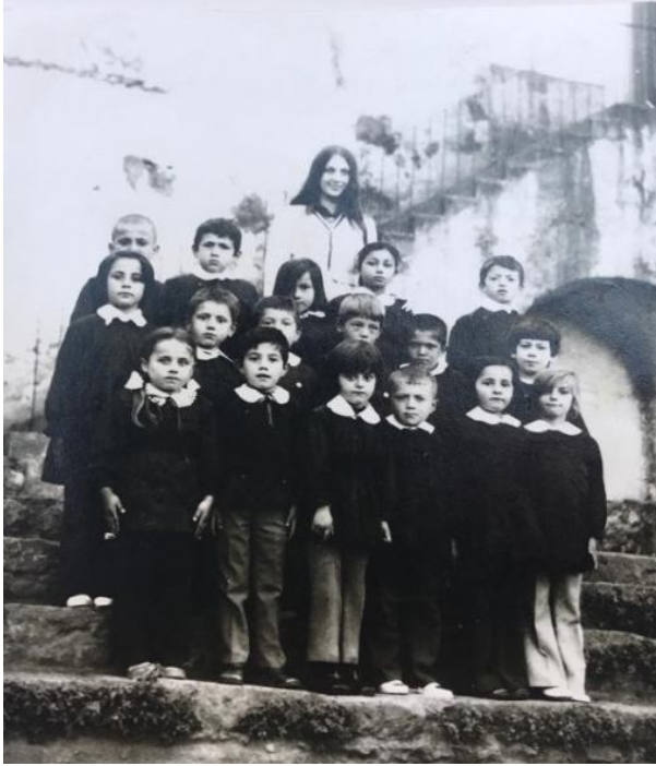
Fotoğraf 45: 1970’li yıllarda Ortamahalle’de bulunan Fevzi Paşa İlkokulu bahçesinde çekilmiştir.

açılan biçki- dikiş kursu fotoğraflarına ulaşılmıştır. Kaynak kişiler ile fotoğraflar incelendiğinde okul kıyafetleri gibi bayram kıyafetlerinin de terziler tarafından dikildiği belirtilmiş, biçki- dikiş kursuna katılan genç kızların önlük ya da forma gibi bir giysileri olmadığı, ancak son derece özenli ve temiz giyinerek kursa geldikleri anlatılmıştır.