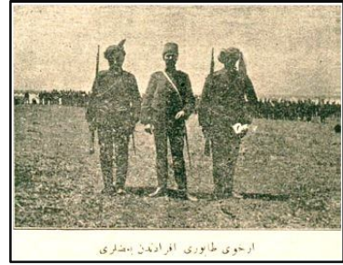
Arhavi Taburu Efradından Bazıları