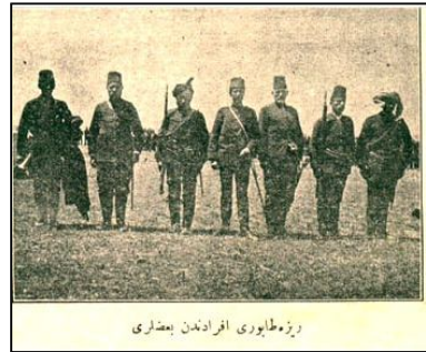
Rize Taburu Efradından Bazıları