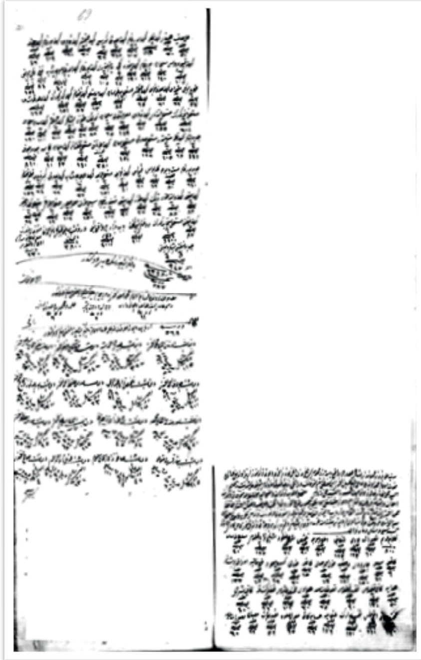
Ek 1. Pazarkapı Camii İmamı Şeyh Hüseyin Efendi'nin terekesi