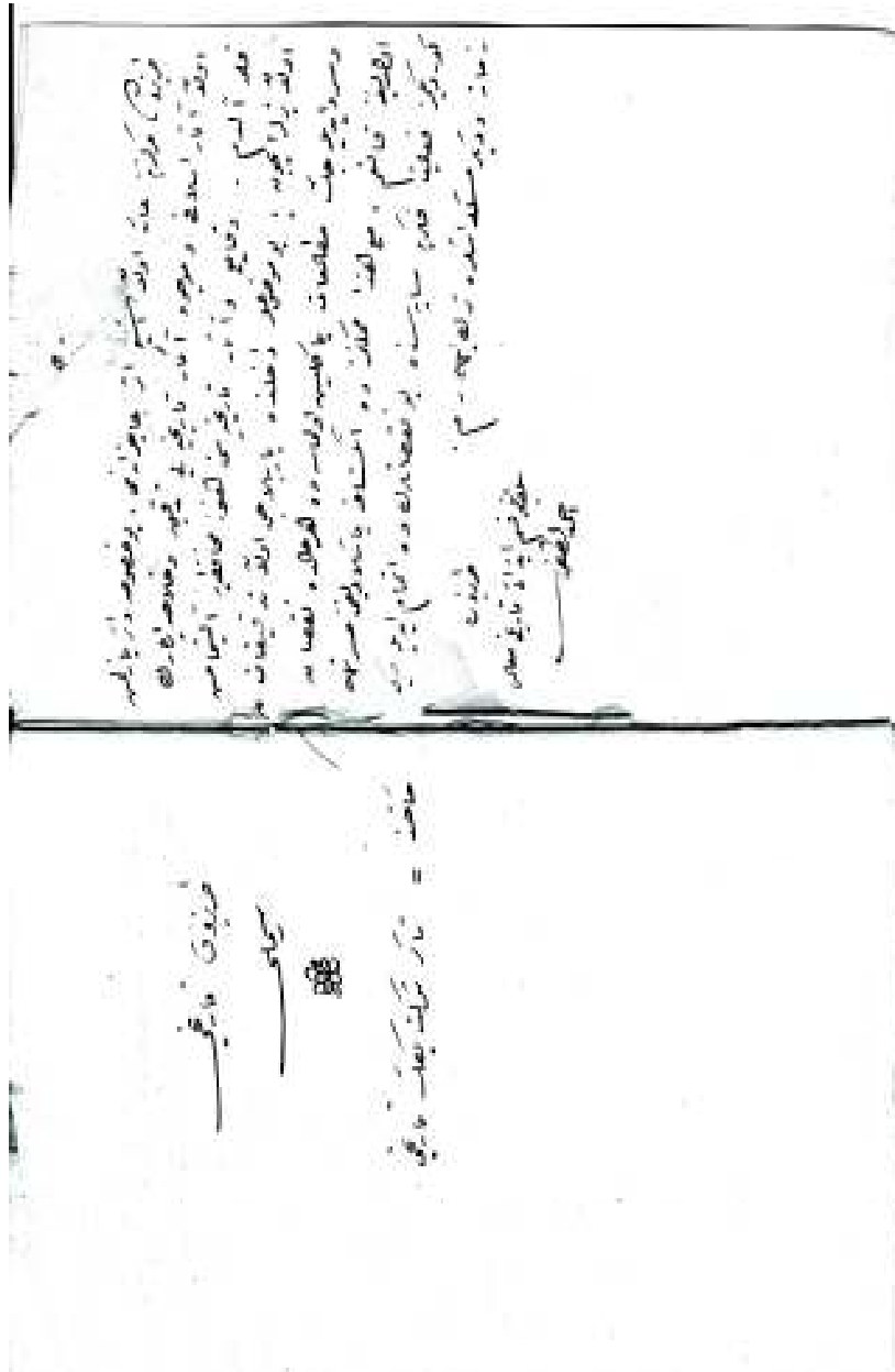
Ahmet Lütfi'nin Trabzon Tarihi'nin ilk sayfaları