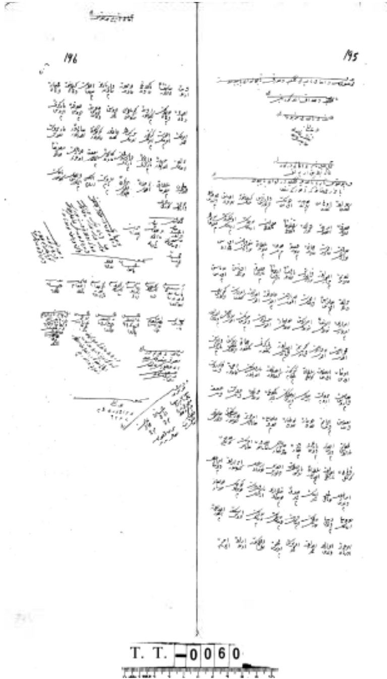
Ek 3. 1516 Tarihli Mufassal Tahrir Defteri