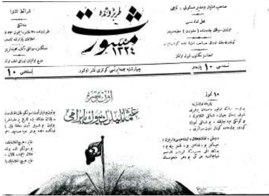
10 Temmuz 1324 tarihli Meşveret Gazetesi