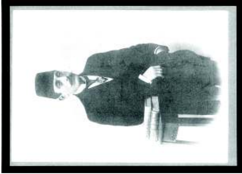
Gençlik Yıllarında Naci Bey