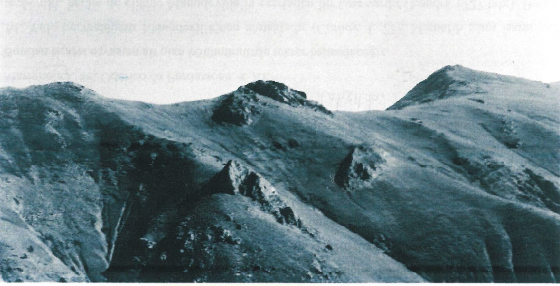
Pontus Kapısındaki Yazlık Mera