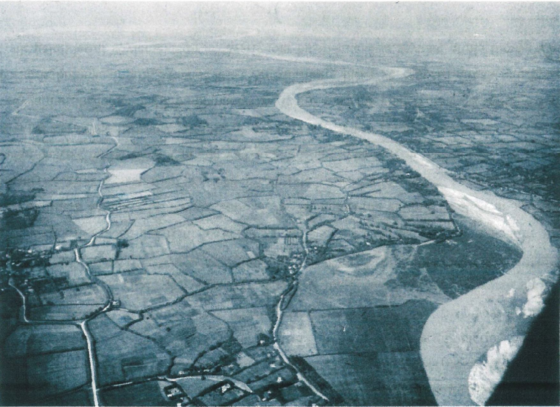
Bir Kış Beyliđi: Limnia