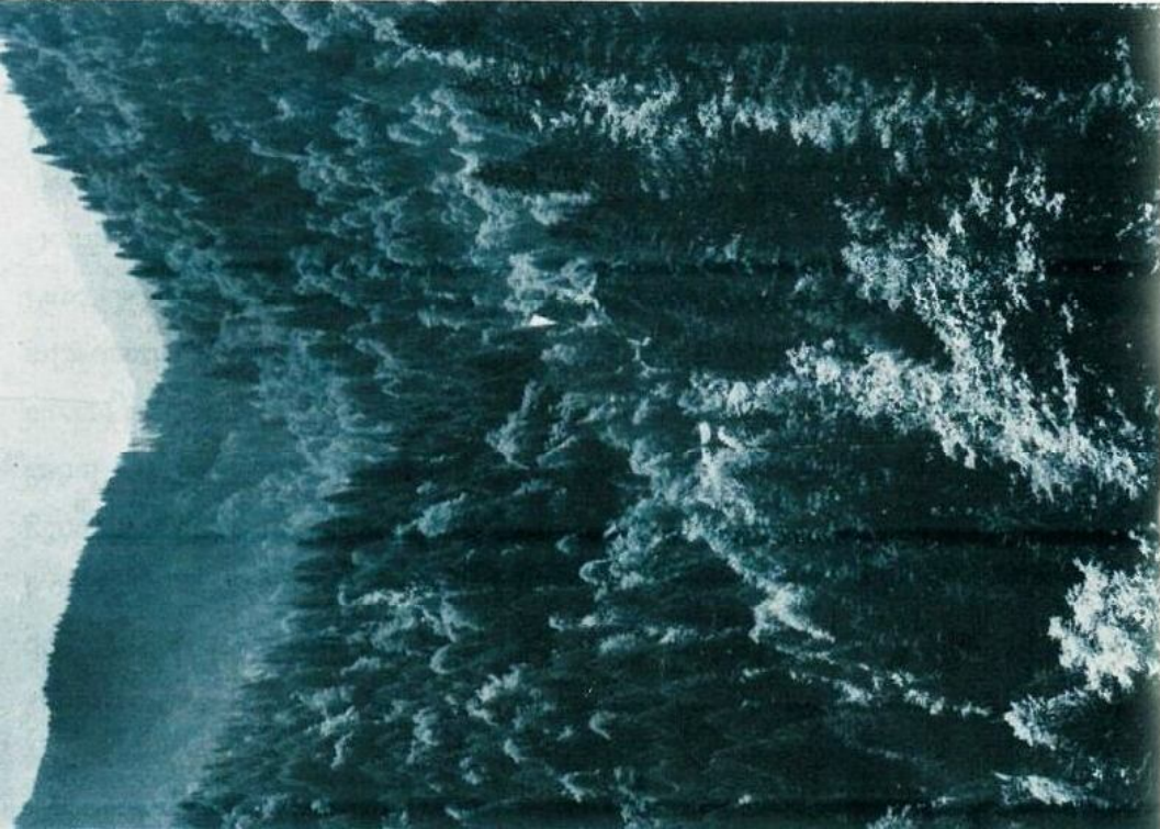
Pontus Yağmur Ormanları