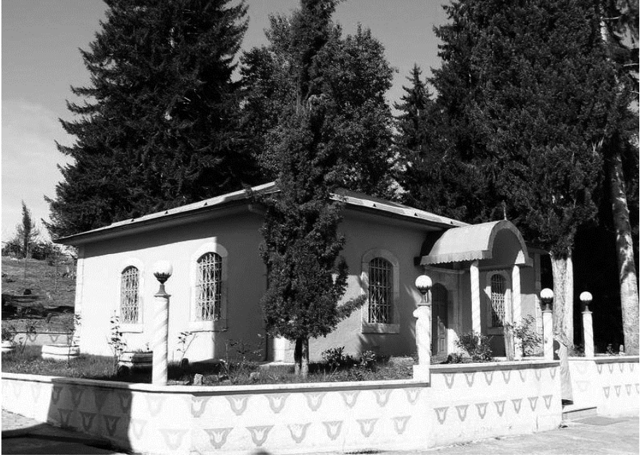
Resim 5: Şeyh Kerameddin Türbesi

Şeyh Kerameddin türbesi, cami, su kuyuları ve mezarlığın da içinde yer aldığı arazi, yaklaşık 25-30 dönüm civarındadır. Cami gibi türbenin de ilk kez kim tarafından nasıl inşa edildiği bilinmiyor. Muhtemelen ahşap olan yapı, Osmanlı'nın son devrinde yıkılarak yığma-kesme taştan inşa edilmiştir. Nitekim vakıf kayıtlarında 1850'li yıllarda türbenin onarımdan geçtiği bilgisine yer verilmiştir. 30