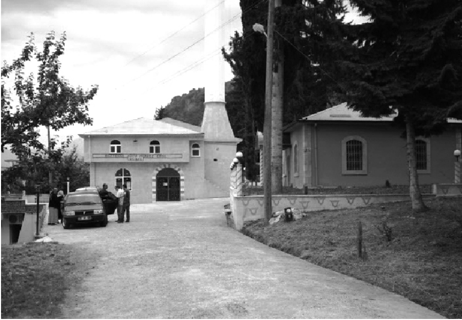
Resim 2: Şeyh Kerameddin Camii ve Türbesi (Merkez / Boztekke Köyü)

etmiştir. Ancak mahkeme gerekli tahkikatı yaptıktan sonra konuyu görüşmüş ve adı geçen şahsı haksız bularak talebini geri çevirmiştir. Bu tarihte Sayaca ve Kızılkaya köylerinde bulunan vakıf yerlerden, zaviyeye yıllık 1000 akçe akar temin edildiği beyan edilmiştir. 14